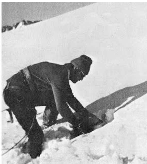
Финальная точка необычной жизни: Пепел Эволы погребают в вечном льде Монте-Розы (1974 год)

Каково значение, на твой взгляд, у циклической картины мира Эволы, которую он рассматривал как духовное наследие индогерманцев?