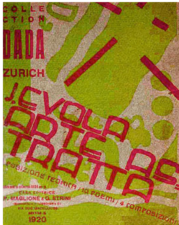
Произведение периода дадаизма Юлиуса Эволы: Arte Astratta (Цюрих, 1920 г.)