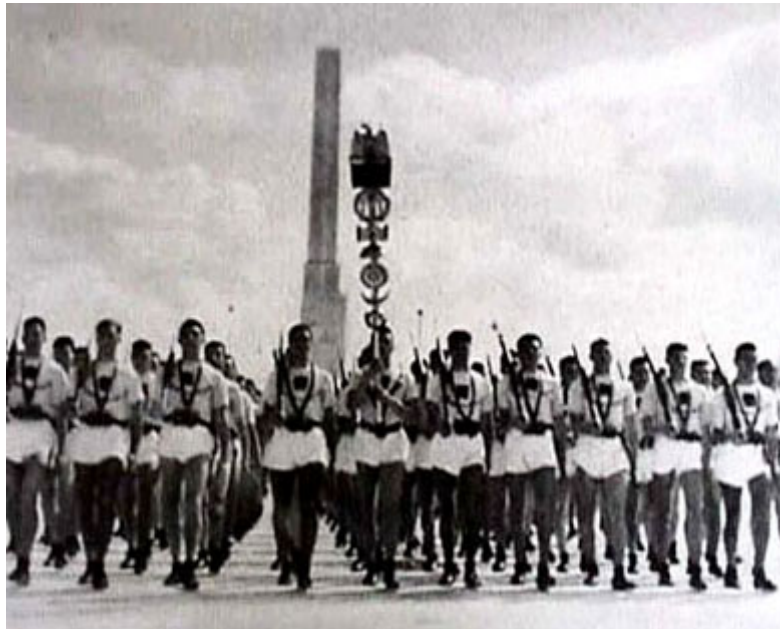
Фашистское восприятие: Фашистская молодежь (GIL) на демонстрации в Риме

Часто ошибочно интерпретируемая антитрадиция футуризма относится, как сказано выше, к пассивному консервированию прошлого. Вместо этого футуризм хотел быть активным. Он хотел жить тем, что мы понимаем под «традиционным». Футуризм также явно был направлен в окончательном виде снова только к точке нуля, и тоже, в конце концов, должен был после этого быть преодолен.