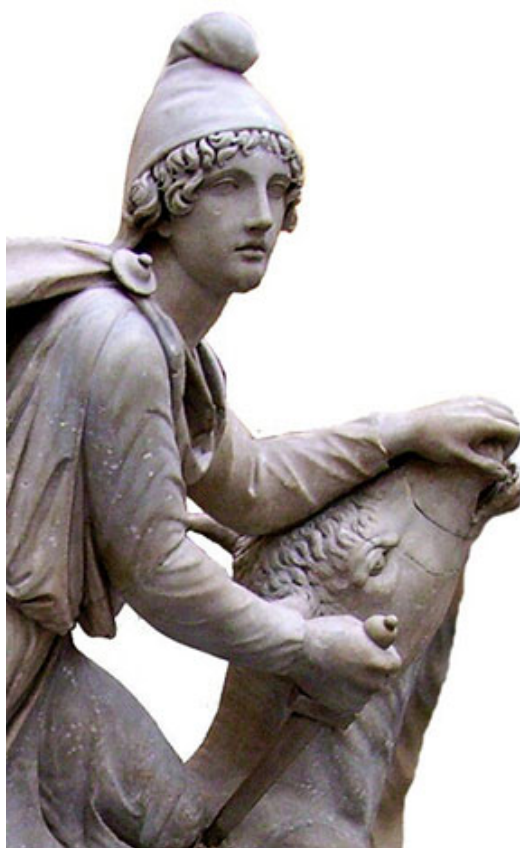
Митра убивает быка