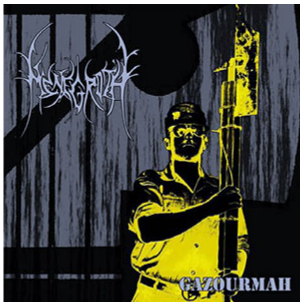
Блэк-металл под знаком традиционализма и гелиократии: Menegroth. Gazourmah

В этой связи мне вспоминается произведение Эволы «Магия как наука о Я» [Julius Evola/Gruppe von UR: Magie als Wissenschaft vom Ich. Grundlegung der Initiation (Band I) и Schritte der Initiation (Band II). Interlaken 1985], которое похоже на руководство для развития личности (в традиционалистском смысле?). Правда ли это? Насколько тяжело успешно идти этим путем?