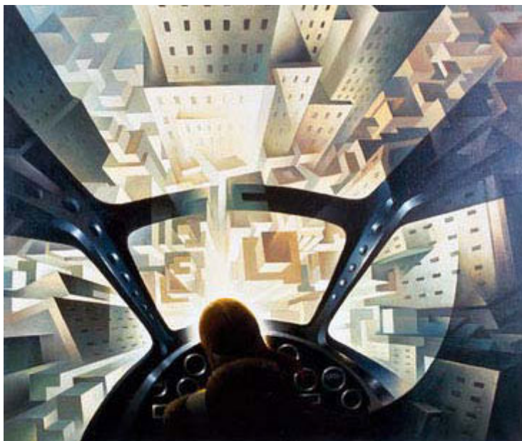
Футуристическая икона: Туллио Крали: «В пике над городом», 1939 год

Интересен также труд доктора Армина Молера «Фашистский стиль» [Armin Mohler: Der faschistische Stil , в: Liberalenbeschimpfung. Drei politische Traktate . Essen 1990], в котором он кратко касается встречи Готфрида Бенна и Маринетти. [Готфрид Бенн, выдающийся немецкий поэт, 1886-1956].