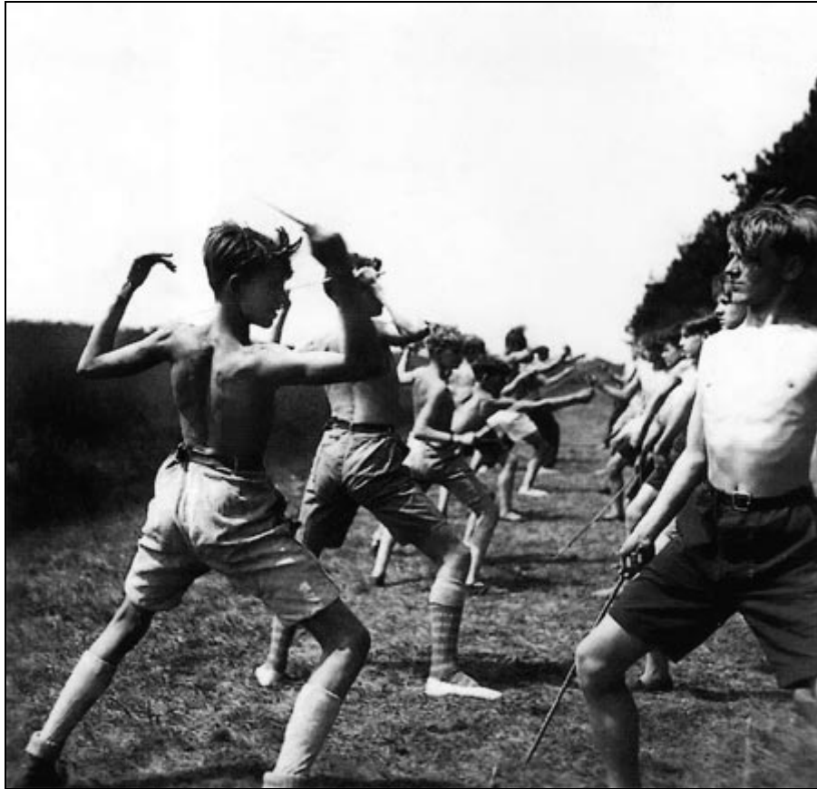
Фехтование на палках, лагерь Райберзее 1930