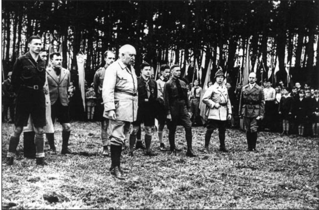
Всегерманский союз молодежи, Берлин, апрель 1933 г. С речью выступает бундесфюрер адмирал фон Тротба. Рядом руководители прежних союзов.