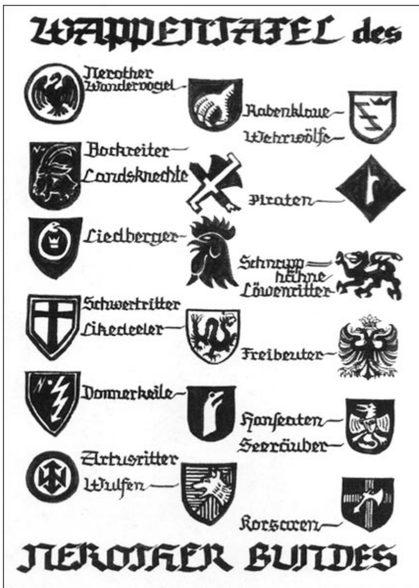
Гербы Неротер Бунда

Одновременно с Вандерфогель оформилась еще одна ветвь молодежного движения, сравнимая с ним по популярности, но во многом и отличная от него. Речь идет о движении скаутов, которое возникло в Англии в 1907 г. Как и в Германии, оно было отмечено стремлением молодых людей к первозданной природе. Источником вдохновения для них стала книга заслуженного генерала и выдающегося руководителя лорда Роберта Баден-Пауэлла (1857-1941) «Цели скаутства». Задуманная как полевой учебник британских солдат, она обрела неожиданную популярность среди английской молодежи. Отношение самого Баден-Пауэлла к этому факту было неоднозначным. С одной стороны, его радовала вновь возникающая связь молодежи с природой, невольным инициатором которой он стал; с другой – он не мог без тревоги наблюдать за тем, как книга, написанная с военными целями, формирует картину мира тысяч молодых людей. В результате для своих последователей им была написана еще одна книга «Скаутство для мальчиков», и он возглавил новое движение.