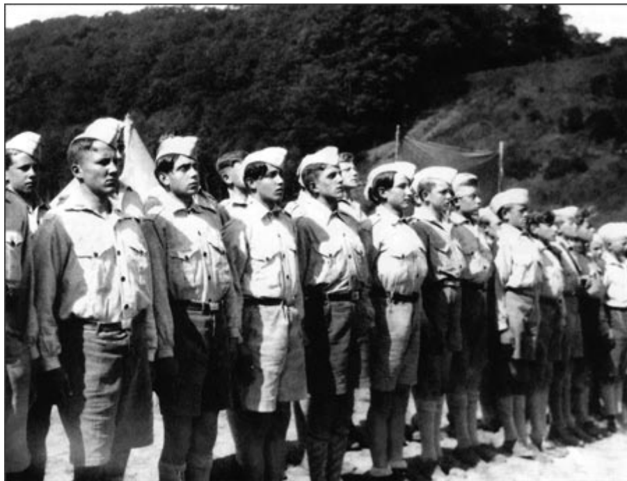
Лагерь Людвигсвинкель, лето 1930

Следствием мировоззрения всегда, к сожалению, становится раздробленность. В молодежном движении все больше и больше утверждалась страсть к полемике, которая вызывала ненужные ссоры. В 1904 г. произошел первый раскол движения, в 1907 г.