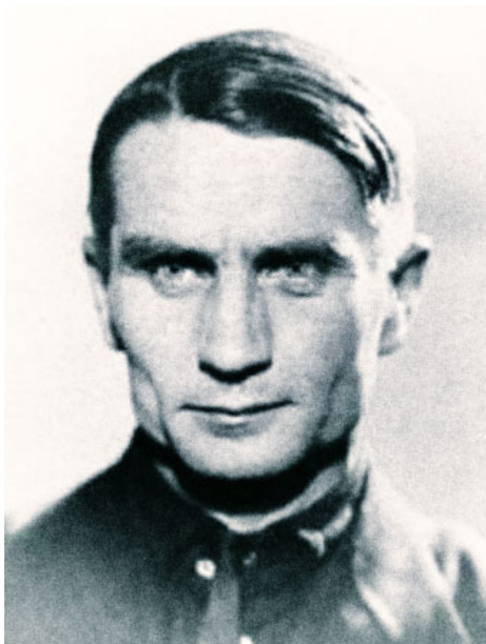
Доктор Зигмунд Рашер (1909-1945)