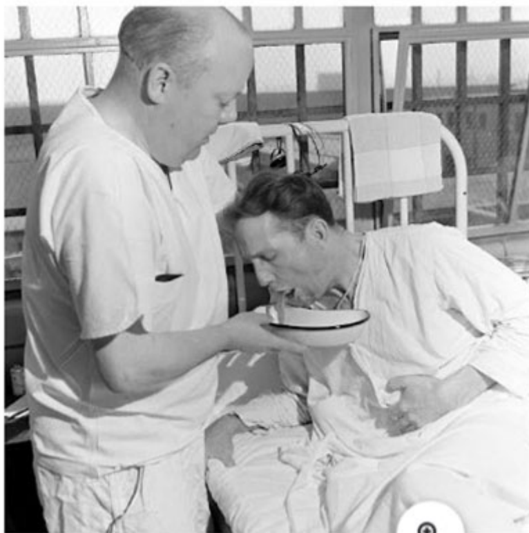
Эксперимент с малярией, проводившийся с заключенными тюрьмы штата Иллинойс.

Прокуратура США привлекла доктора Эндрю Айви для объяснения различий в медицинской этике между медицинскими экспериментами в Германии и США. Интересно, что сам доктор Айви принимал участие в экспериментах по исследованию малярии, которые проводились на заключенных в тюрьме штата Иллинойс. Когда доктор Айви упомянул, что в Соединенных Штатах существуют определенные стандарты исследований для медицинских экспериментов на людях, оказалось, что эти принципы были впервые опубликованы 28 декабря 1946 года, через 19 дней после начала судебного процесса. Доктору Айви пришлось признать, что американские принципы этики при проведении медицинских экспериментов на людях были выработаны в ожидании показаний доктора Айви на суде над нацистскими врачами. [32]