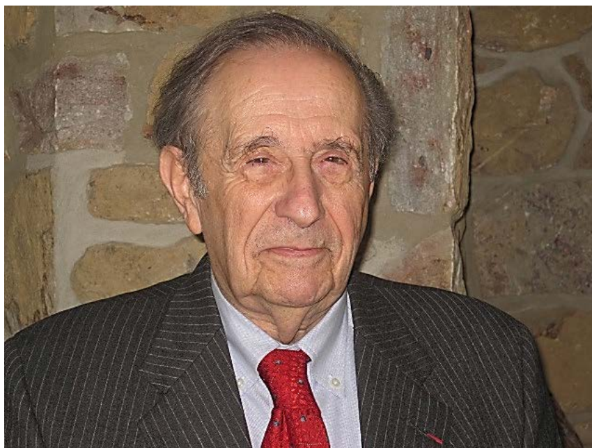
Доктор Стэнли Алан Плоткин (род. в 1932 году)

Эта статья была впервые опубликована в журнале The Barnes Review, номер за сентябрь/октябрь 2021 года.