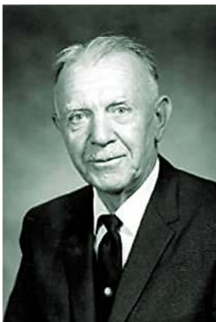
Доктор Хубертус Штругхольд (1898-1986)

Во время войны Рашер передавал свои отчеты доктору Хубертусу Штругхольду, директору Института авиационной медицины Люфтваффе. Штругхольд также посетил медицинскую конференцию, на которой рассматривались исследования Рашера. После войны Штругхольд был отправлен в Соединенные Штаты в рамках сверхсекретной программы операции «Скрепка» ( Operation Paperclip ), которая предлагала немецким ученым иммунитет от судебного преследования в обмен на их научный опыт. [27]