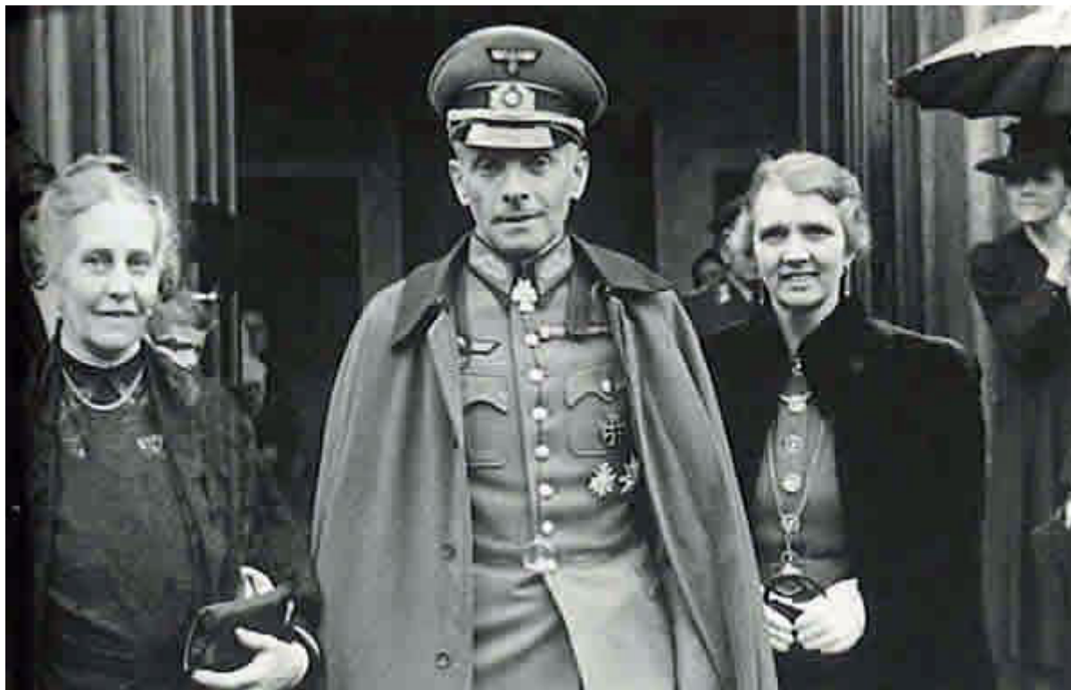
Майор Ганс Остер

Одним из таких офицеров Абвера, сыгравших заметную роль в жизни Канариса и немецкого антигитлеровского движения сопротивления, был майор Ганс Остер. Хотя их характеры были очень разными, Канарис и Остер объединились против того, что они считали ошибочной внешней политикой Гитлера и режимом внутреннего террора. Подполковник Гельмут Гроскурт, пользовавшийся в значительной степени доверием Канариса, был еще одним видным офицером Абвера, активно работавшим над свержением гитлеровского режима [xxiii].