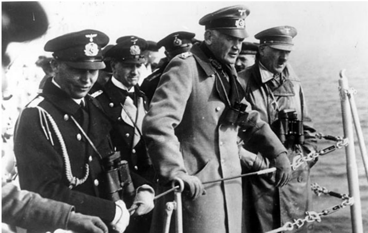
Фельдмаршал фон Бломберг с Гитлером, апрель 1934 года

скрытен. Однако Редер преодолел свои опасения по поводу Канариса, назначив его главой Абвера 1 января 1935 г. [xx].