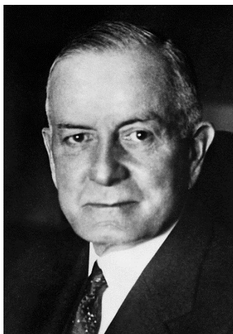
Томас Дж. Уотсон (1874-1956)

Томас Дж. Уотсон был президентом IBM во время правления Гитлера в Германии. Блэк, который называет Томаса Уотсона «корпоративным негодяем», особенно критически относится к управлению Уотсоном IBM (стр. 23, 31 и далее). Уотсон приступил к исторической экспансии Dehomag всего через несколько недель после прихода Гитлера к власти. Фактически центральный офис IBM инвестировал более семи миллионов рейхсмарок, чтобы значительно расширить возможности своего немецкого филиала по производству оборудования для Германии. Блэк пишет, что приверженность Уотсона расширению бизнеса в Германии казалась неослабевающей (стр. 50, 67).