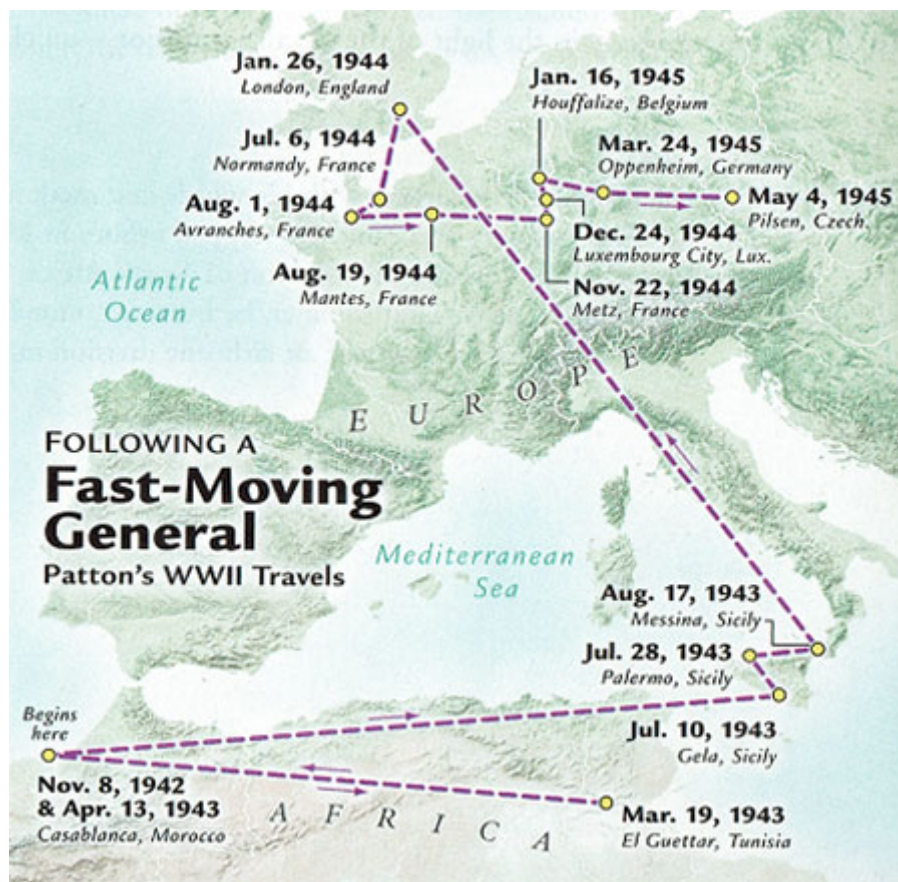
«Быстрый генерал». Перемещения Паттона во время Второй мировой войны.

Паттон записал в своем дневнике об остановке, помешавшей окружить немцев у Фалеза: «Эта остановка [была] большой ошибкой. Похоже, девиз [Брэдли] звучит так: «В случае сомнений остановись». Хотел бы я быть верховным главнокомандующим». [4]