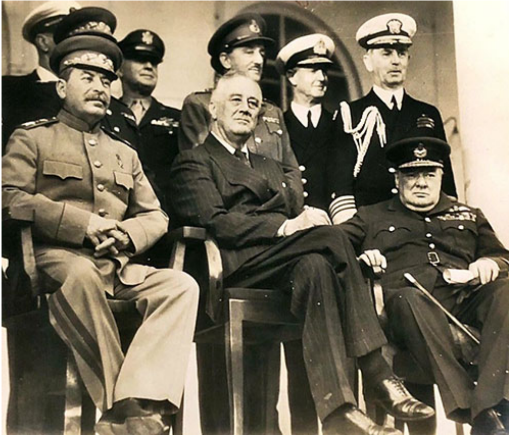
«Большая Тройка» на Тегеранской конференции

Британский историк Бэзил Генри Лиддел Харт взял интервью у многих ведущих немецких военных деятелей и обнаружил, что они согласны с тем, что политика безоговорочной капитуляции союзников продлила войну. Немецкие генералы говорили, что без политики безоговорочной капитуляции они и их войска, что было еще важнее, были бы готовы сдаться раньше, поодиночке или коллективно. [11]