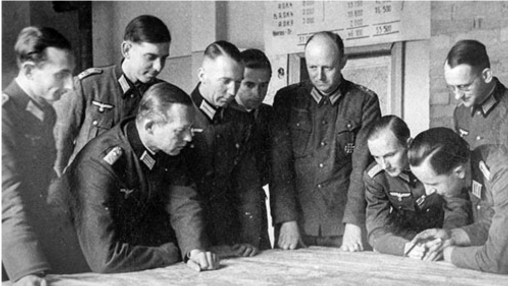
В центре: генерал-майор Хеннинг фон Тресков

Доктор Ойген Герстенмайер, бывший заговорщик и председатель федерального парламента (Бундестага) Западной Германии после войны, заявил в интервью 1975 года: «То, что мы в немецком сопротивлении не хотели видеть во время войны, мы в полной мере узнали впоследствии; что эта война, в конечном счете, велась не против Гитлера, а против Германии». [19]