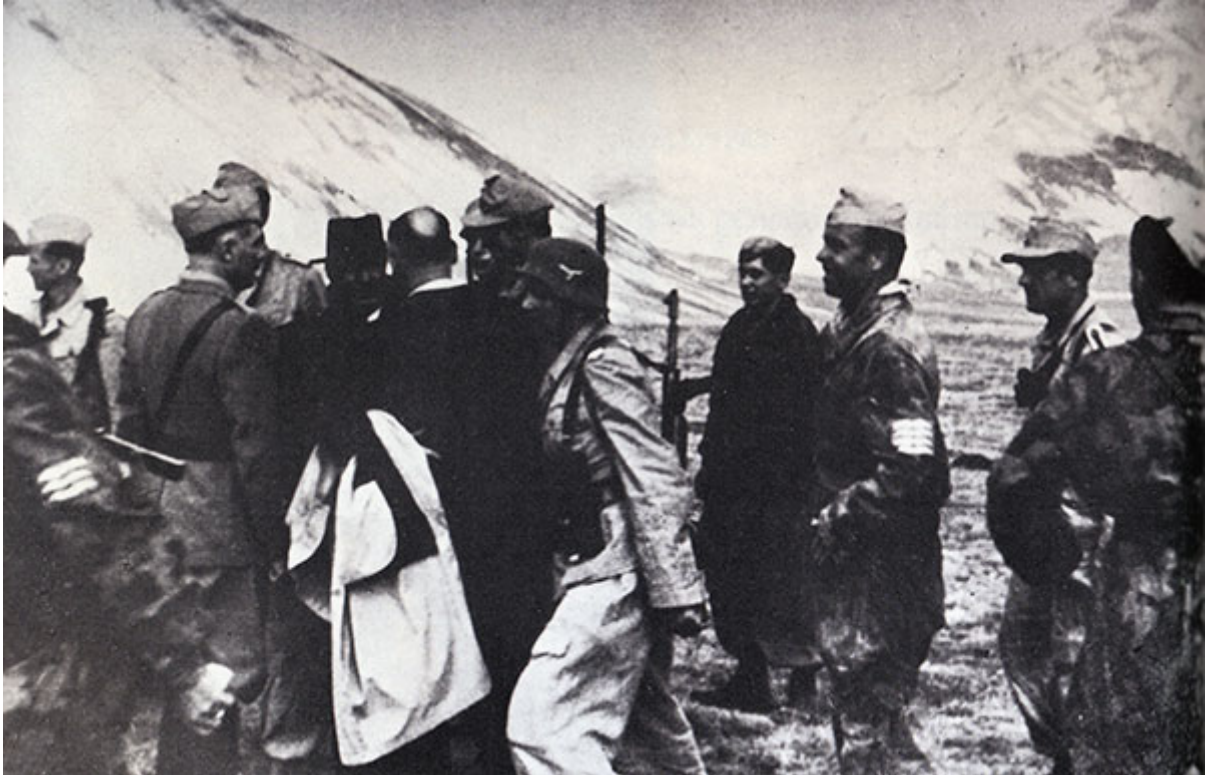
12. September 1943: Mussolini mit seinen Befreiern, dem italienischen General Soleti und seinem Bewacher General Cueli.