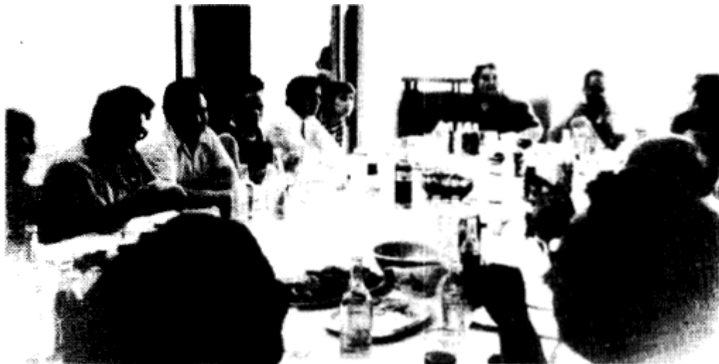
Сотрудники бюро «Новостей» при посольстве СССР в Индии за своим любимым времяпровождением – пьянством.

Если для номенклатуры и бездельников «Новости» предлагают относительно удобную жизнь с «легким налетом творческой работы», то идеалистам АПН может дать иллюзию, будто бы они делают что-то для «мира и взаимопонимания». Я знал много молодых коллег, которые, хотя и понимали зловещую природу «Новостей», но все еще надеялись, что после получения некоторой власти они «изменяют систему изнутри». Этим людям было нелегко сохранять свои идеалы, честность и здравомыслие. Многие совершили болезненный переход от высокого идеализма до глубокого цинизма. Только незначительное меньшинство «верных товарищей» могло продолжать упрямо верить в возможность «социализма с человеческим лицом». Они не могли сделать хорошую карьеру: партии не нужны такие преданные идиоты в ее более высоких кругах. Я не помню примера честного человека в АПН. То, что я действительно помню, так это широко известный в Москве факт, что «Новости», возможно, держат первое место по количеству психически больных, алкоголиков, садистов, мазохистов, шизофреников, графоманов, и т.д., и являются чем-то вроде убежища для всех видов сумасшедших, о которых никогда не сообщали в психиатрический институт имени Сербского – то есть, пока они продолжают симулировать лояльность к власти. И таковы кадры, которые «решают все» в деле идеологической войны против остальной части мира.