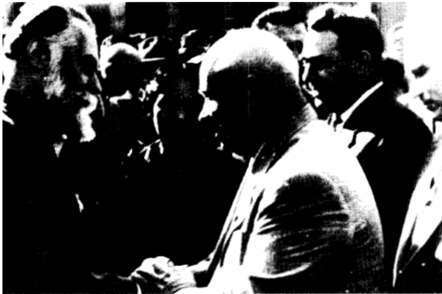
Никита Хрущёв и Леонид Брежнев дружески общаются с художником-эмигрантом Святославом Рерихом и его индийской женой в Москве.