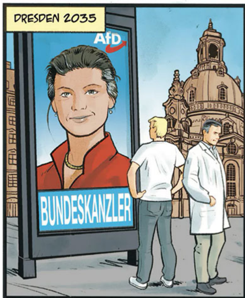
Это сильно постарело. Из журнала комиксов «Hydra Comics» №. 1 (2021)

Воображаемый роман сразу же осложнился. Восхваляя Вагенкнехт всего несколько недель назад, политики и избиратели АдГ теперь нападают на нее самыми нелепыми способами. Я не могу не думать, что виноваты только они сами. Вагенкнехт всегда была очень последовательной в своем неприятии правых. Люди просто отказывались слушать.