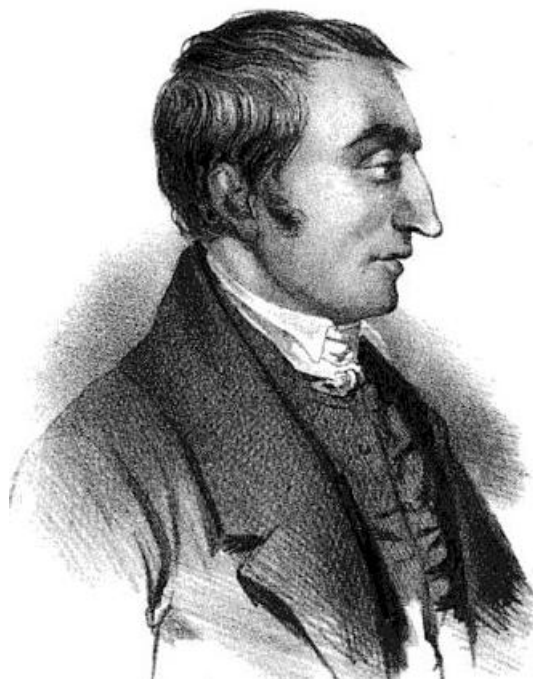
Анри де Сен-Симон

карманов гуманитариев, произвел много разнообразной чепухи, которая все еще остается в моде. Он осуждал «колониализм» и говорил, что обязанностью преуспевающих стран было обеспечить техническую и финансовую помощь «слаборазвитым странам», чтобы промышленно развить целый мир и сделать всех такими же счастливыми, как жаворонки.