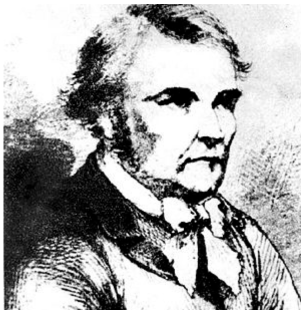
И выдающийся мошенник-фальсификатор Дени Врэн-Люка.