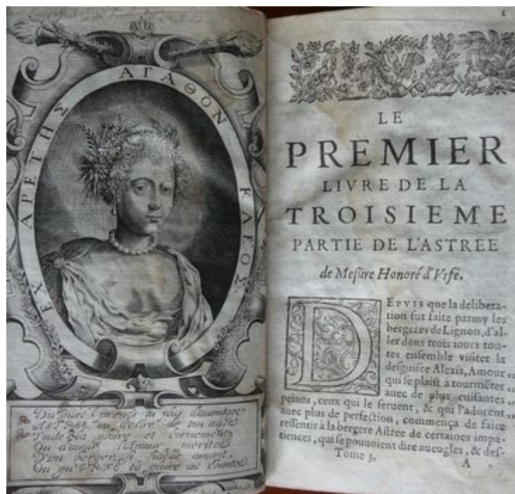
Гравюра с изображением Жанны д'Юрфе

Мадам д'Юрфе, с которой Казанова познакомился, когда она уже была давно не молода, была одной из самых богатых и самых блестящих женщин во Франции. Она была не только образованной в обычном смысле. Мадам д'Юрфе занималась химией, в которой у нее были хорошие знания и навыки. Она оборудовала тщательно продуманную лабораторию в своем доме. Ей также приписывают изобретение лабораторной печи, которая автоматически поддерживала сравнительно постоянную температуру в течение многих дней.