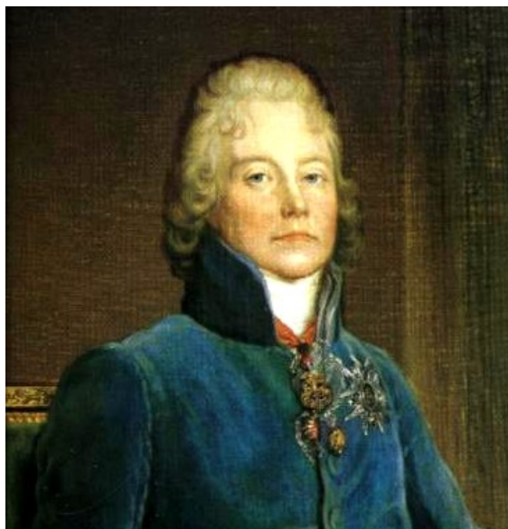
Шарль-Морис де Талейран-Перигор (1754-1838)

Если вы захотите поговорить о принципах или даже о долгосрочных целях с представителями этих чрезвычайно влиятельных политических сил, то вам нужно будет надеть пеструю одежду шута и колпак с бубенчиками. Единственными аргументами, которые будут убедительны для них, являются аргументы вроде тех, которые всегда учили преподобного епископа Талейрана тому, когда точно будет выгодно отвернуться от своих менее ловких партнеров и плюнуть им в лицо. Некоторые историки утверждают, и это может быть правдой, что у Талейрана были свои принципы. Если это так, то он никогда не позволял им вмешиваться в его поведение. Он был человеком большого таланта и проницательности, и он всегда находил правильный момент и правильный способ присоединиться к победившей стороне как раз тогда, чтобы эта сторона помогла ему подняться еще выше. Когда возраст, наконец, заставил его выйти в отставку, он был столь же ловок в искусстве расположить к себе впечатлительных историков, разыгрывая перед ними сожаление из-за тех методов, которыми он достиг известности. Он – одна из сравнительно немногих идеальных моделей для блестящих и прагматически настроенных молодых людей сегодня.