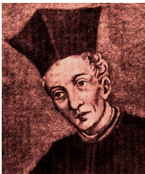
Испанский писатель и философ Балтасар Грасиан (1601-1658)