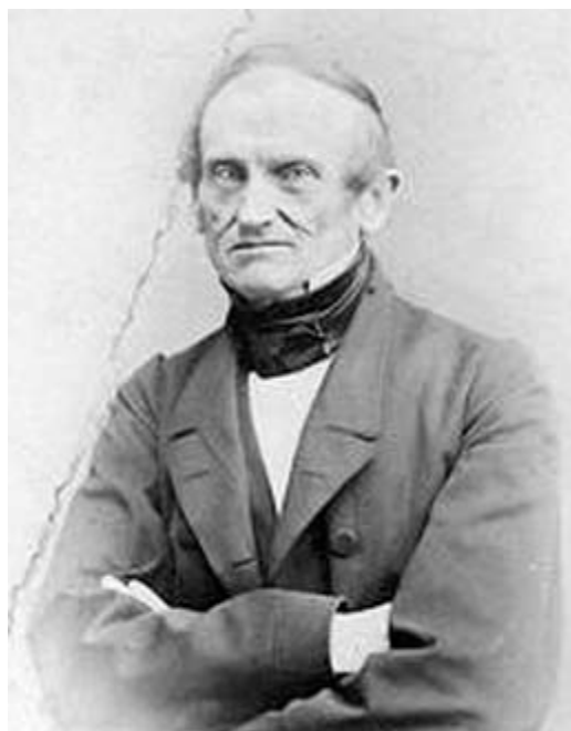
Выдающийся математик Мишель Шаль

письмо, которое Клеопатра написала своим разборчивым почерком – и стальным пером – на тряпичной бумаге – да еще и на французском языке шестнадцатого века!