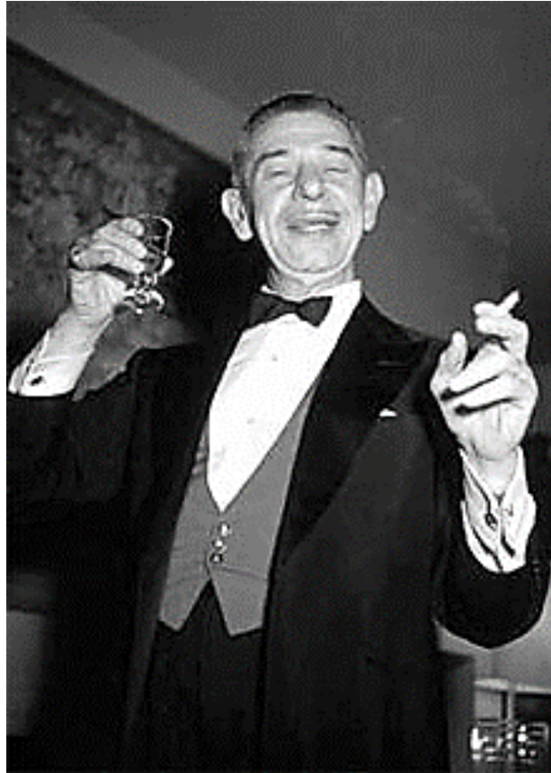
Гарри Гергюсон, урожденный Гершл Гергузин, он же «Майкл Романофф», актер, фокусник, певец, ресторатор, авантюрист и мошенник (1890-1971)

Когда в наши дни материализуется еще один чудом сохранившийся Романов, нормальная реакция – усталая улыбка, но я полагаю, что, если бы кто-то сидел напротив человека, который спокойно объявляет, что он Его Императорское Высочество, Царь Всея Руси, Августейший Атаман всех Казачьих войск, и т. д., ему довелось бы просто сглотнуть. Друзья Голеневского не только сглотнули: они проглотили.