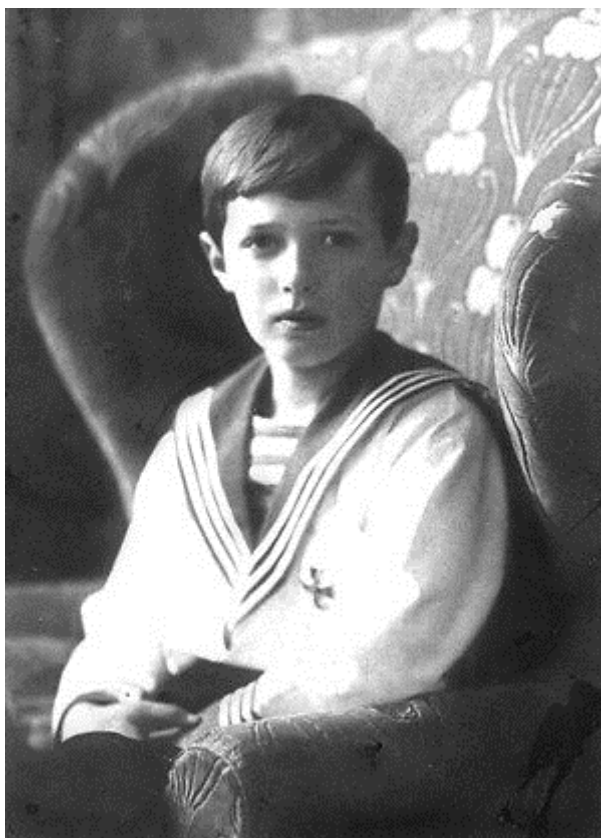
Царевич Алексей Николаевич (1904-1918)

Императорская семья не была убита в Екатеринбурге – вовсе нет. Король Великобритании Георг V и кайзер Германии Вильгельм II сотрудничали, чтобы спасти своих августейших родственников, а их секретные службы, используя щедрые взятки, осуществили побег Николая II, императрицы Александры Федоровны, и их пятерых детей, которые были увезены на восток через Сибирь во Владивосток, где они сели (разумеется, инкогнито) на пароход, доставивший их в Соединенные Штаты. Они пересекли американский континент на поезде, а затем сели на лайнер, который привез их обратно в Европу. (Более поздняя редакция: они бежали на юг через занятую белыми территорию России в Одессу на Черном море, где их ждал британский линкор.) Благополучно высадившись на берег в какой-то неуказанной стране в Западной Европе, царь решил спрятаться и избежать узнавания. Так он привел свое семейство в Польшу, страну, которая была частью его владений и где портреты его и его семьи ежедневно видел каждый не слепой поляк. В этой стране, которая тогда находилась в состоянии фактической анархии и которой угрожало массовое вторжение большевиков из России, царь и его семья спокойно обосновались под видом семьи скромных польских помещиков, совершив интеллектуальный подвиг мгновенного изучения польского языка, который сильно отличается от русского. Эти усилия, возможно, сделали Николая несколько рассеянным, поскольку он совершенно забыл о сбережениях в размере 400 миллионов дол-