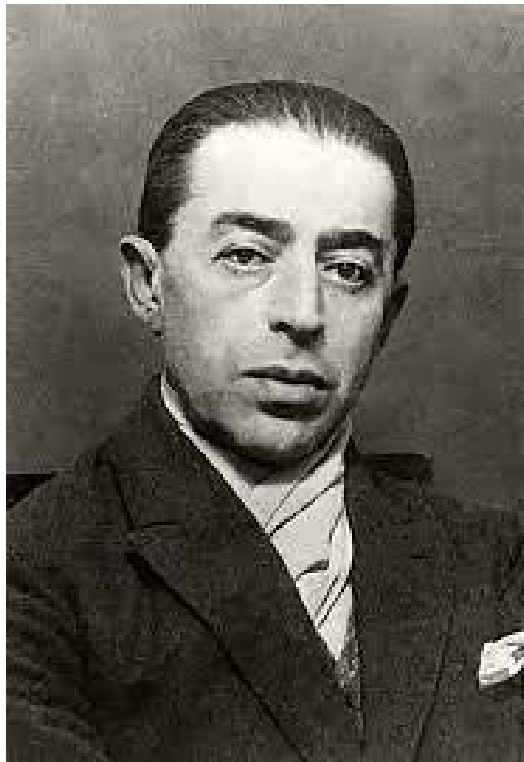
Сидней Рейли (Зигмунд или Шломо Розенблюм, 1873-1925)

Конечно, разношерстные евреи так хитры, что иногда могут свести на нет обычные меры предосторожности. Самый известный пример – еврей из России, который выдавал себя за ирландца по имени Сидней Рейли и с помощью хитроумной уловки проник в британскую военную разведку. С тайной помощью своих соплеменников он добился таких успехов в качестве шпиона, что был поставлен во главе британского шпионажа в России в то время, когда его раса захватила Российскую империю в 1917-1918 годах.