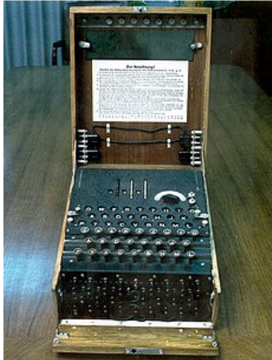
Немецкая шифровальная машина «Энигма»

Когда мы устроили засаду и убили величайшего военачальника Японии адмирала Ямато, пилотам пятнадцати-двадцати истребителей, которые с максимальной высоты обрушились на большой командирский самолет адмирала, нужно было точно сообщить, когда и где они должны были его ожидать, но им не сказали, что мы знали об этом, потому что мы читали самые секретные из японских военно-морских шифров и поэтому имели полный и точный график инспекционной поездки Ямато. Уничтожение величайшего военного ума Японии и деморализующее воздействие на японцев потери их почитаемого полководца, которого они считали практически непобедимым, были великой победой, но она могла быть и пирровой. Она была достигнута с большим риском, но не в самом бою, поскольку самолет Ямато был практически легкой добычей для атакующих, а для нашей стратегии в войне на Тихом океане.