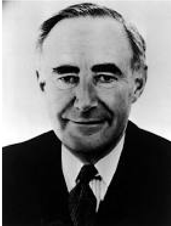
Роджер Холлис (1905-1973)

Автор статьи утверждает, что Холлис не был «кротом», и ограничивается тем, что говорит лишь то, что улики против него, изложенные Пинчером, были получены путем «копания в пыли». Таким образом, он признает подлинность доказательств, но отрицает их значение и интерпретацию, сделанную на их основании. Из этого, то есть из того, что доказательства не были сфабрикованы, следует, что Холлис, если и не был предателем, то был более доверчивым и менее безжалостным, чем имеет право быть руководитель национальной разведывательной службы. Ну, это вполне возможно, но вот автор странным образом почему-то не упоминает об этом, хотя он, вероятно, надеялся, что кто-то из его читателей сам откроет это для себя.