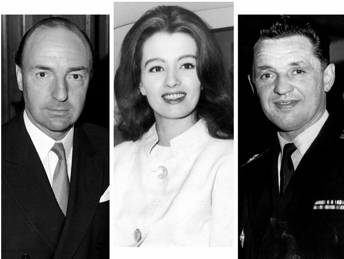
Слева направо: Джон Профьюмо, Кристин Килер, Евгений Иванов

Такова статья в Private Eye , предположительно написанная для того, чтобы снять с мертвого Холлиса и живого Ротшильда подозрения в том, что они были «кротами». Но если у вас есть настойчиво подозрительный ум, который исходит от знакомства с операциями разведывательных служб, вы поймете, чего на самом деле добилась эта статья: