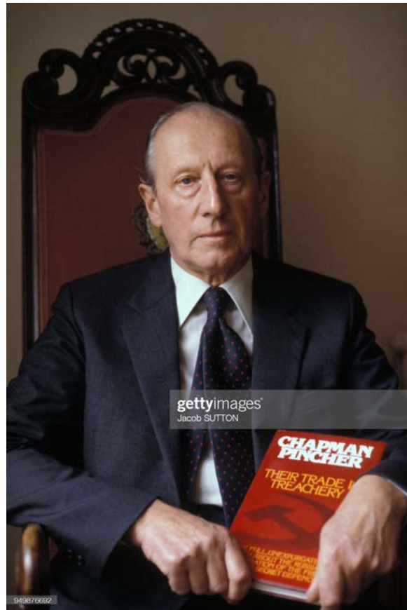
Английский журналист Чепмен Пинчер (1914-2014)

Он нападает на книгу Пинчера, заявляя, без сомнения, правильно, что журналист Пинчер получил информацию от бывшего офицера МИ-5 Питера Райта, которому заплатили за нее более 31 000 фунтов стерлингов в рамках сделки, которая была организована и, возможно, финансировалась одним очень влиятельным лицом, богатым евреем, выросшим в Англии, которого глупые британцы даже возвысили до пэра как лорда Ротшильда. Цель сделки и публикации состояла в том, чтобы навести подозрение на покойного Холлиса и, таким образом, отвести его от Ротшильда, который в рассматриваемые годы был высокопоставленным членом МИ-5, уступавшим по авторитету только Холлису, и который, как бы невероятно это ни могло показаться, имел с собой в качестве коллеги-чиновника еврейку, ставшую его женой.