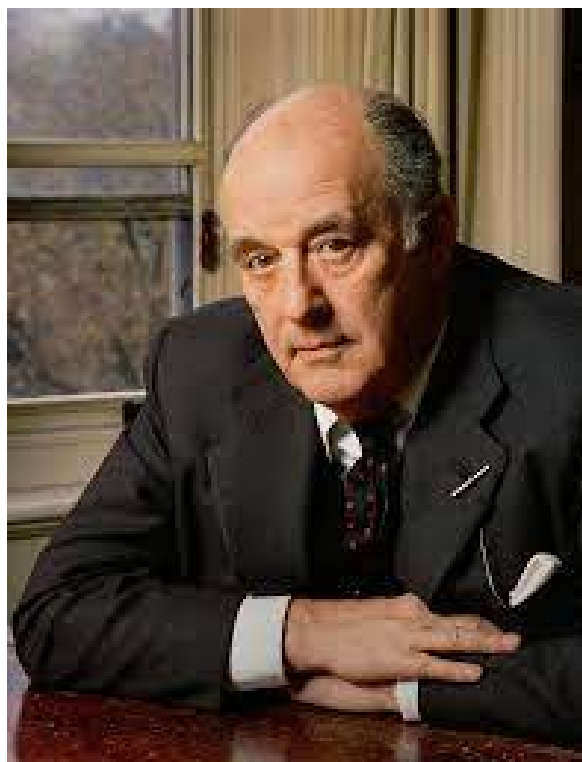
Виктор Ротшильд (1910-1990)