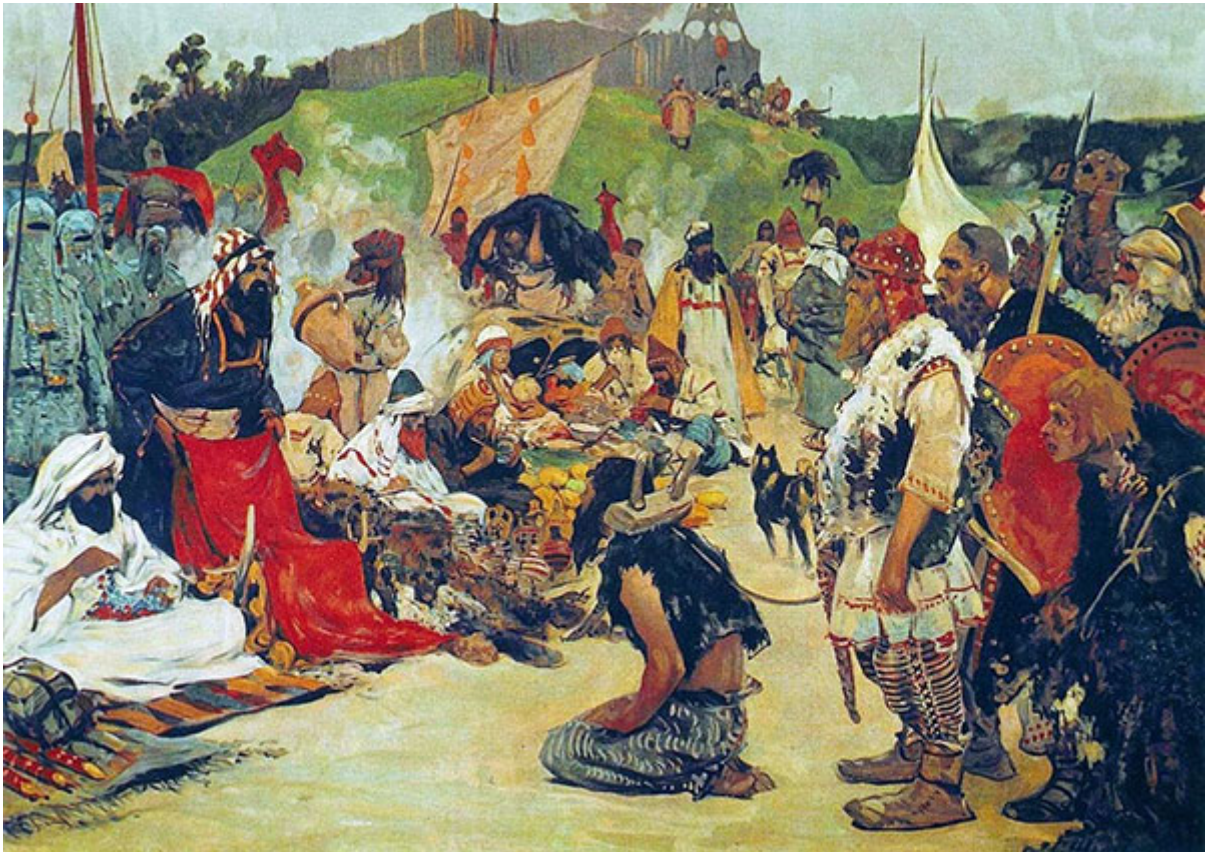
«Торг в стране восточных славян». Художник С. В. Иванов, 1909 г.

недооценку, европейская работорговля, которая повлекла за собой торговлю белыми, не менее важна для моральной расплаты за исторические злодеяния. Отсутствие серьезного обсуждения восточноевропейской работорговли и шведской работорговли, которая длилась с шестого века до Средневековья, предполагает, что нынешние дискуссии мотивированы враждебностью к белым, а не желанием исправить исторические ошибки.