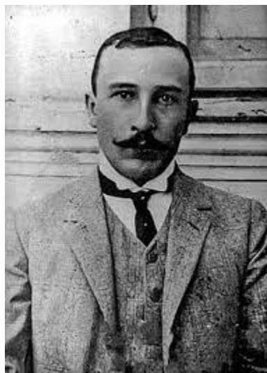
Борис Викторович Савинков (1879-1925)

Снова и снова бойцы задаются вопросом, действительно ли они сражаются на стороне народа и истинной России. Как и в «Бледном коне», сдержанная, хладнокровная литературная стилизация превращается в маску и доспехи повествователя от первого лица, под защитой которых он, проницательный наблюдатель и одновременно увлекаемый потоком событий активный участник происходящего, движется сквозь хаос «безрассудства, буйства и бунта».