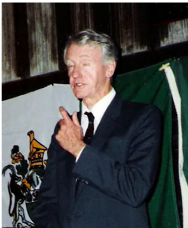
Ян Дуглас Смит (1919-2007)

Перевод с английского, 2022 г. На русском языке публикуется впервые!