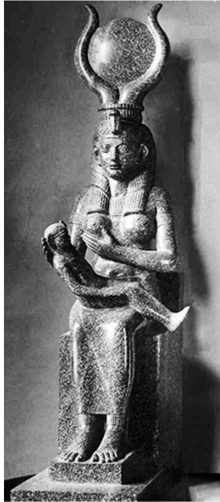
Исида кормит грудью своего божественного сына Гора

(египетская скульптура времен правления династии Птолемеев, 304-30 до н.э.)