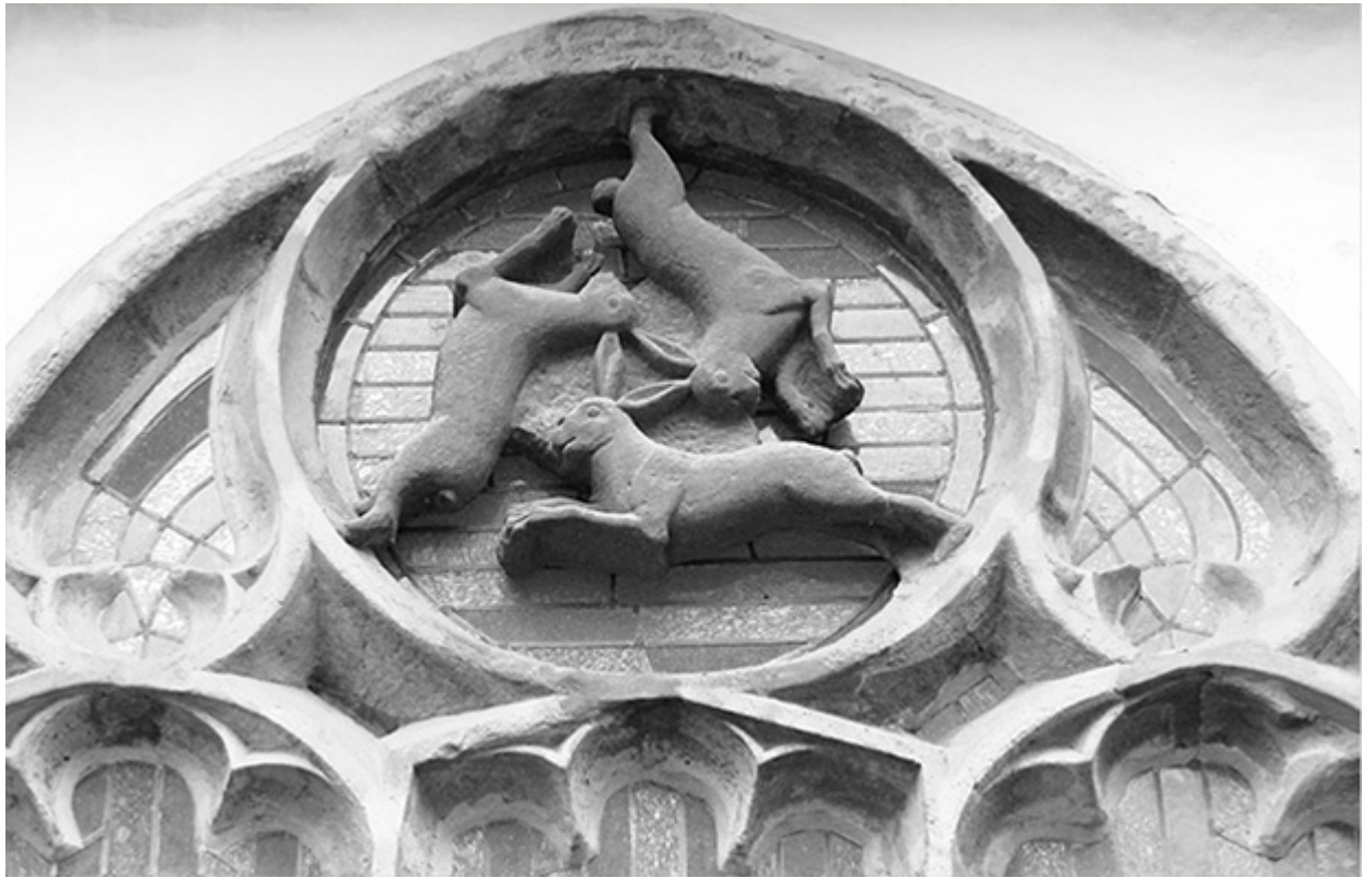
Окно с тремя зайцами. Падерборнский собор

Празднуемое в августе «Вознесение Марии» заменило более древний языческий праздник благодарности за урожай, тесно связанный с Матерью-землей, как символом плодородной почвы, порождающей плоды, из чего нужно, кстати, даже выводить сам слог «Ма» в имени «Мария». Как супруга небесного божества представление о вознесении также опирается на язычество.