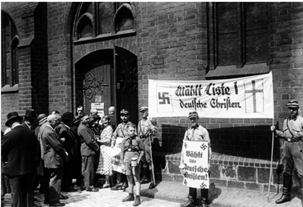
В мае 1921 г. Иоахим Нидлих и пастор Эрнст Бублиц основали «Союз за Германскую Церковь». Союз пропагандировал нордический образ Христа. Фото: Выборы в церковный совет при поддержке штурмовиков. 23 июля 1933. Перед входом в церковь св. Марии в Берлине

Богостремление каждой вещи, внутренне заминированной полуреальным Божеством и детонирующей от магических колебаний «имманентного Ничто» – это религия как минимум беспокойная. Мир в ней – процесс, каждая вещь – заброшенность, Бог – нереальность, а Божество – повсеместная данность духовного становления, внутренние горизонты которого очерчены лишь короткой упрямого непонимания. Если думать лишь о Ничто – эти горизонты будут съедены сами собой, растворены и разорваны внутренним противоборством, ибо в действительности их нет, а есть лишь тотальная жизнь Духа, запакованного в эфемерную оболочку и готового просиять сквозь неё, устраняя преграды и взрывая всё «Данное».