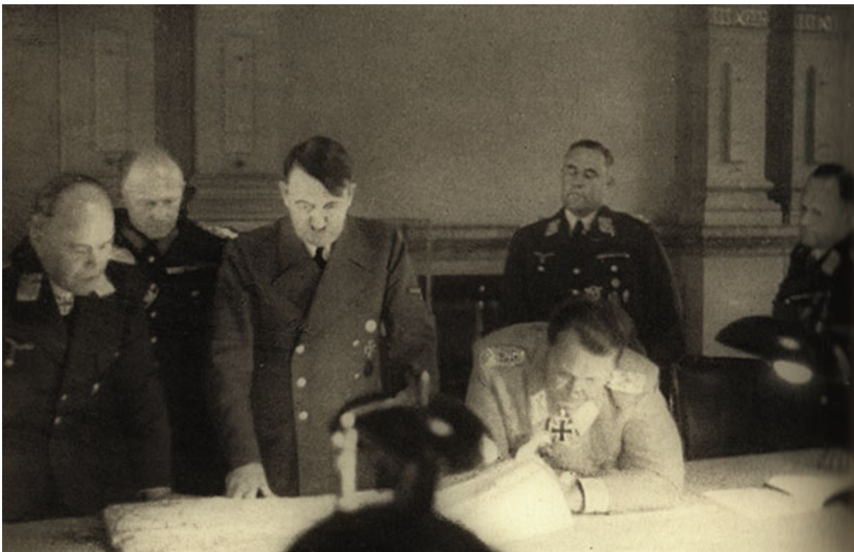
Июньский доклад в Рейхсканцелярии о моих оперативных планах в русской кампании. Слева направо: Кессельринг, Йодль, Гитлер, Геринг, Боденшатц, Мильх.

Говоря о блицкриге, я уже упоминал о том, что, когда накануне начала Польской кампании Гитлер сообщил мне о заключении пакта о ненападении между Россией и Германией, с души у меня упал тяжелый камень. Это произошло 23 августа 1939 года; теперь же была середина 1941 года. Неужели за минувший короткий двухлетний период ситуация настолько изменилась, что я мог отбросить страхи, которые некогда меня терзали? После ухода из Дюнкерка британские войска не могли больше осуществлять крупномасштабные операции. Не были готовы к проведению крупных операций и британские Королевские ВВС. Наш северный фланг прикрывали армия Фалькенхорста и воздушный флот Стумпфа, размещавшиеся в Норвегии, а наш южный фланг – Африканский корпус Роммеля и итальянцы; наконец, в результате быстротечной кампании нами был подавлен балканский очаг сопротивления. Вступление в войну Соединенных Штатов находилось под вопросом и в любом случае было делом не ближайшего будущего.