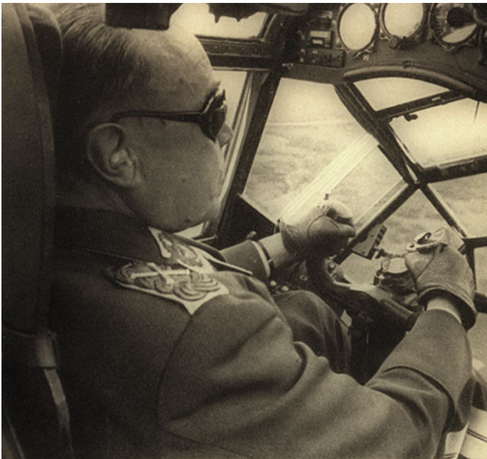
Kesselring in seinem FW 189 über den Weiten Rußlands