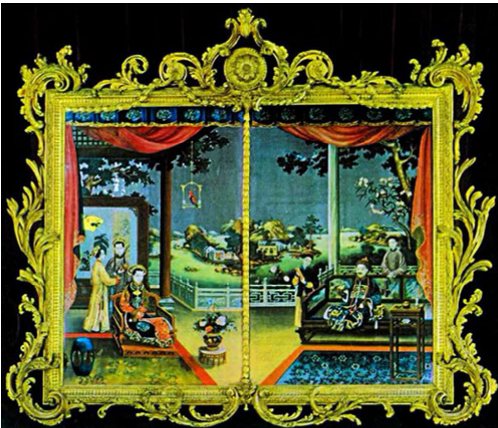
Изысканная рама Чиппендейла для двух зеркал в стиле «шинуазри», 1769 г.

Гостиная у нас была зеленая, увешанная картинками, на которых было изображено множество удивительных птиц, пристально и удивленно смотревших с полотен в застекленных рамах на аквариум с живой форелью, - такой коричневой и блестящей, словно ее подали под соусом, – и на другие картинки, например, «Смерть капитана Кука» и весь процесс заготовки чая в Китае, нарисованный китайскими художниками. – Чарльз Диккенс, «Холодный дом».