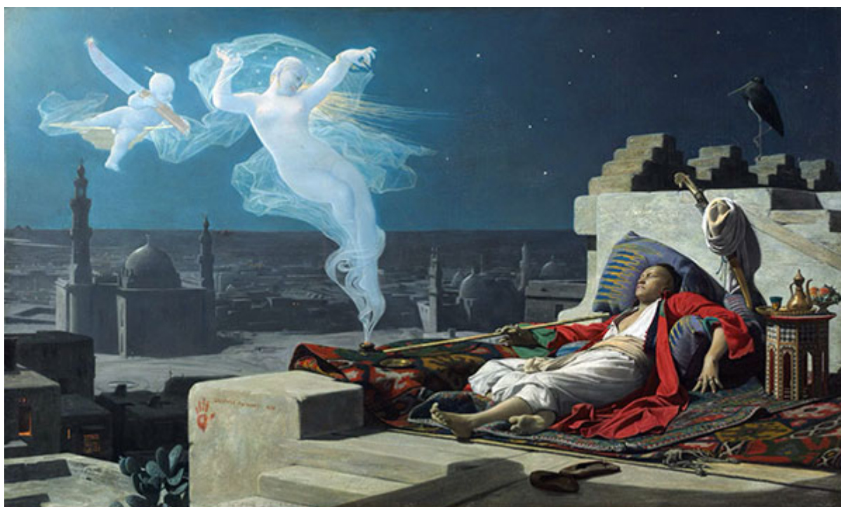
«Сон евнуха», Жан-Жюль-Антуан Леконт дю Нуи, 1874 г.

Перевод с английского, 2022 г. На русском языке публикуется впервые!