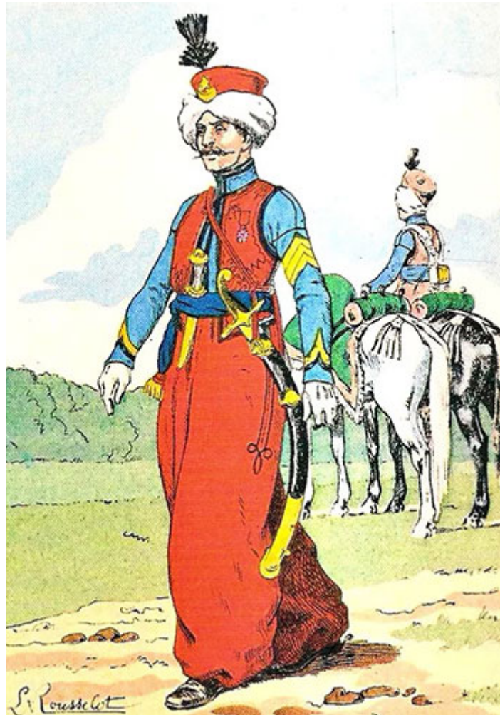
Консульская гвардия Наполеона, одетая в североафриканскую одежду: красиво, но сложно.