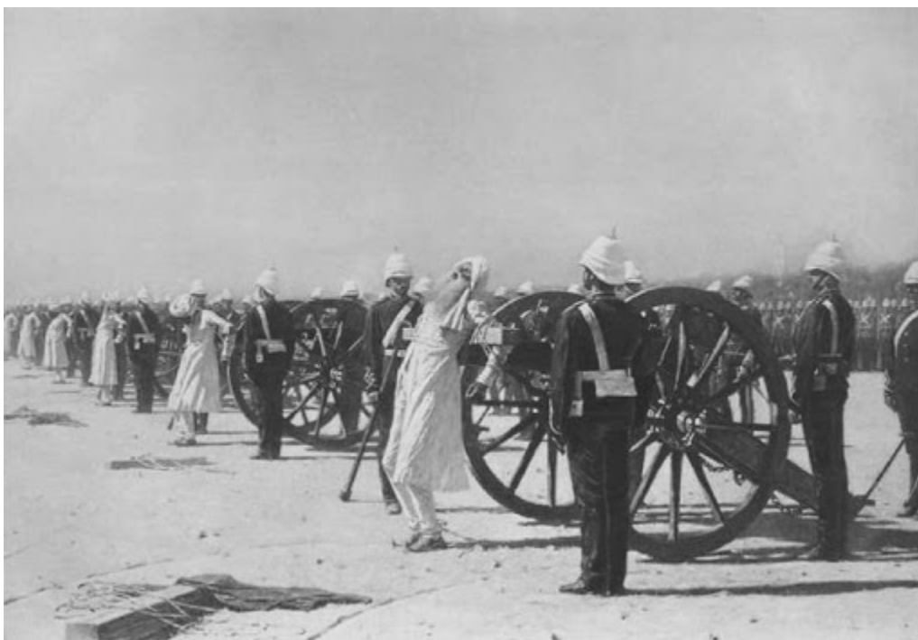
Казнь плененных сипаев