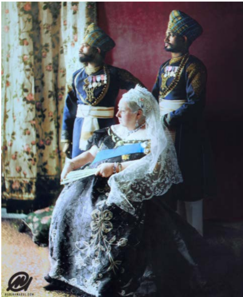
Мы очень счастливы вместе. Королева Виктория и индийцы.

Впоследствии британское правительство отменило власть Ост-Индской компании, и Индия стала территорией Короны, которой непосредственно управляла королева Виктория (теперь Императрица Индии) в установившейся системе правления, известной как Raj , британское колониальное правление в Индии. Последующие десятилетия были заполнены британскими заверениями самих себя, что их новое колониальное правление якобы решило все проблемы и устранило злоупотребления со стороны Ост-Индской компании, некомпетентность которой, по-видимому, привела к Мятелу. Они участвовали в пропагандистской кампании, которая романтизировала Индию и преувеличивала любовь и верность индийцев Великобритании и королеве. Это было чем-то вроде другой кампании примирения во второй половине девятнадцатого века, происходившей в Америке, но менее убедительной (вероятно, благодаря тому факту, что бывшие воюющие стороны в Гражданской войне в США были представителями одной и той же расы). Более циничные наблюдатели отметили, что «Восстание создало наследие расовой ненависти, которая проникала во все аспекты отношений между правителем и управляемыми». [15] По крайней мере Сипайское восстание привело к годам подозрений и страха.