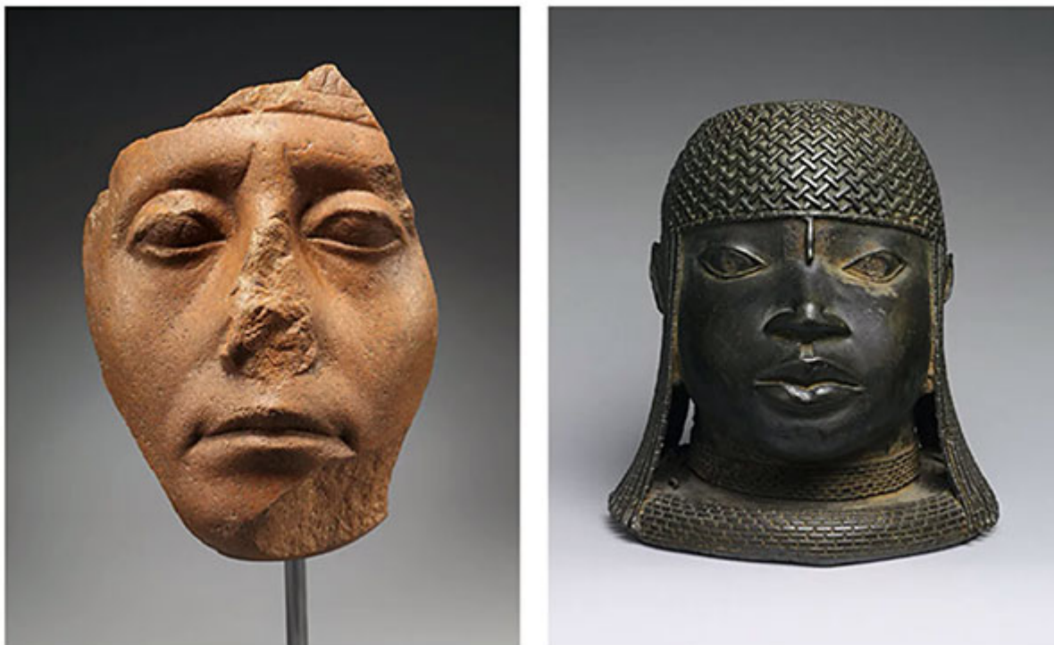
Лицо Сенусерта III (около 1878-1840 гг. до нашей эры) и голова «оба» (шестнадцатый век). Поразительное сходство...

время как у оба широкий нос, толстые губы и более круглые глазные орбиты. Короче говоря, у Сенусерта европеоидные черты, а у «оба» – негроидные.