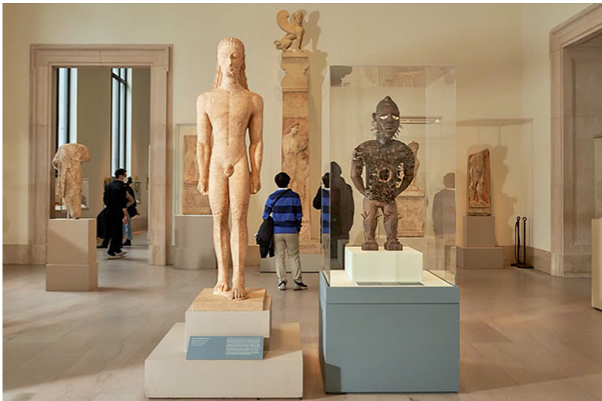
Мраморная статуя юноши (590-580 гг. до нашей эры) и «фигура силы мангаака» (девятнадцатый век).

Еще более вопиющим примером этого является инсталляция Метрополитеном африканских произведений искусства в галереях по всему музею. Эти «гостевые выступления» призваны осветить «неожиданные межкультурные связи» между Африкой и другими культурами. Например, скульптура девятнадцатого века из Конго была помещена рядом со знаменитым «ню-йоркским куросом», древнегреческой статуей аристократического афинского юноши. Здесь не найти связей. Смысл этого сопоставления, по-видимому, в том, чтобы сделать заявление о том, что африканские произведения искусства связаны с искусством великих цивилизаций, но оно лишь подчеркивает тот факт, что коренастый деревянный человечек выглядит довольно неуместно в море греческих статуй. Выглядит так, будто бы он бродил по музею и заблудился. Может, это такой замысловатый троллинг?