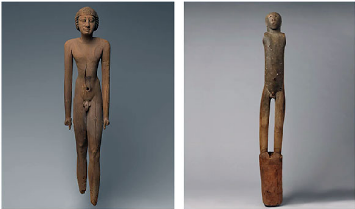
Египетская мужская фигура (около 2255–2152 гг. до нашей эры) и мужская фигура бонго (африканский народ, проживающий в нынешнем Южном Судане, конец девятнадцатого века)

Прямая осанка юноши и постановка ног напоминают египетские статуи, в том числе, по совпадению, два произведения, представленные в «Африканском происхождении цивилизации» – статуя Ка обнаженного мужчины времен Древнего царства и статуэтка Среднего царства. В действительности «курор» является хорошим примером египетского влияния на древнегреческое искусство, которое возникло в результате основания Навкратиса (Навкратиды), греческой торговой колонии в дельте Нила, в седьмом веке до нашей эры. На выставке обнаженная египетская фигура соседствует со скульптурой, показанной ниже. Опять же, непонятно, в чем смысл этого сравнения. Почему бы вместо этого не сопоставить египетскую фигуру с «курором»? Полагаю, в этом было бы слишком много смысла.