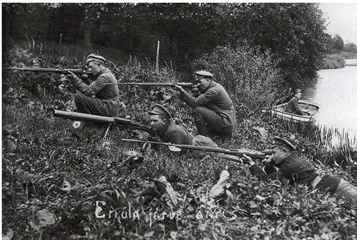
Эстонские солдаты в бою во время Эстонской войны за независимость. Латвия, май 1919 года.

Перевод с английского, 2022 г. На русском языке публикуется впервые!