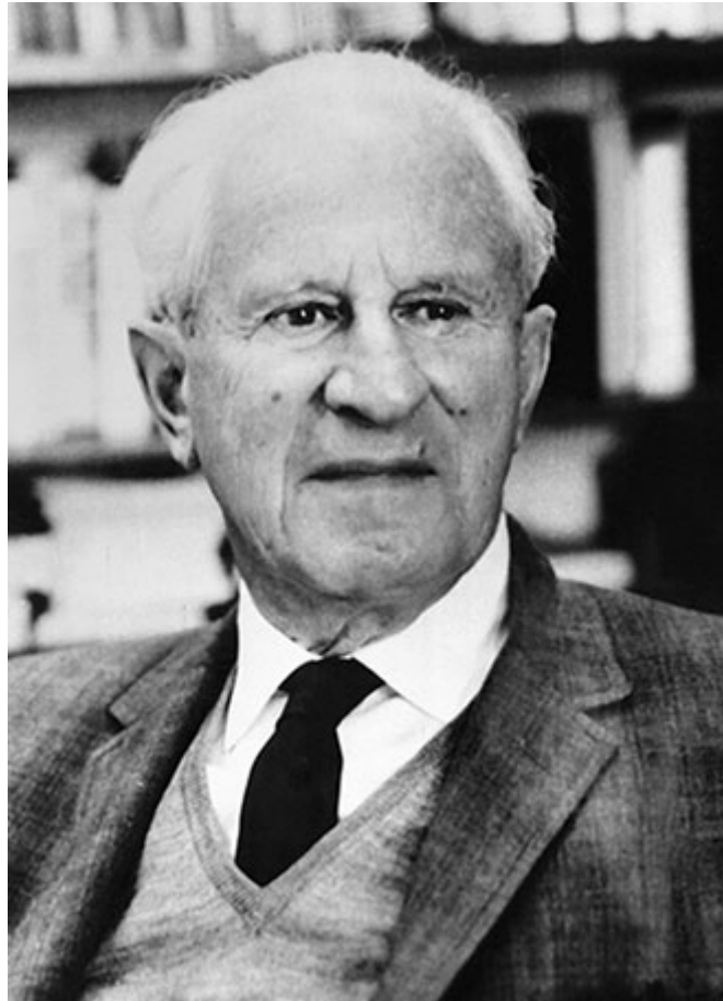
Герберт Маркузе (1898-1979)

Ошибка традиционного консерватизма заключалась в том, что консерваторы думали о Просвещении как сугубо об идеологии, а не как о движении, глубоко укоренившемся в уникальной склонности западных народов оправдывать свои действия на основании своих знаний и способностей к рациональному мышлению. Консерваторам следовало бы предложить рациональные объяснения важности традиций, общинных уз и естественного неравенства людей, а не полагаться на обращения к «установленному Богом миропорядку» или к «авторитету истории и традиции».