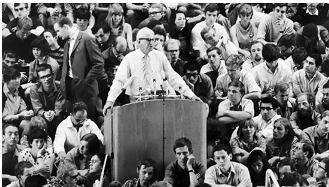
Белые студенты размышляют над лекцией Герберта Маркузе об «одномерном уме» белой расы.

Перевод с английского, 2020 г. На русском языке публикуется впервые!