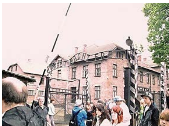
Фото 4: 'Arbeit Macht Frei' («Труд делает свободным»).