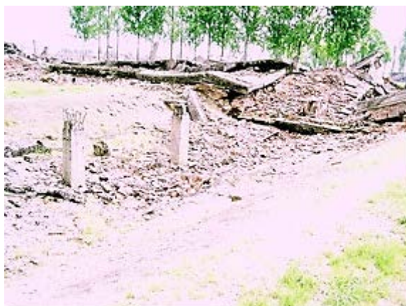
Фото 17: Предполагаемая газовая камера крематория 3.