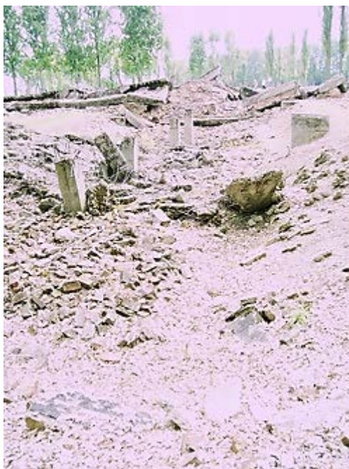
Фото 15: Руины крематория 3.