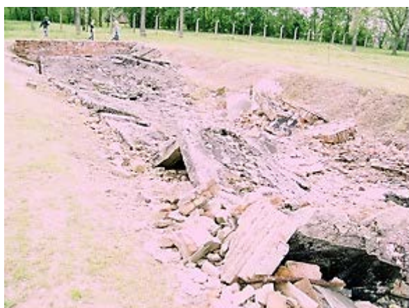
Фото 16: Предполагаемая газовая камера крематория 2.