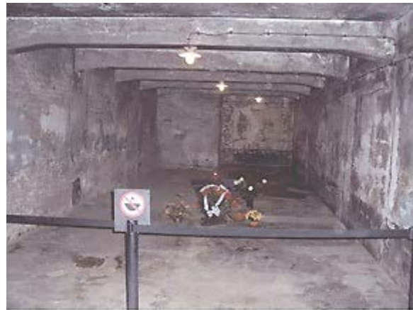
Фото 10: Предполагаемая газовая камера крематория 1.