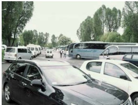
Фото 1: Автостоянка перед Освенцимом.

Краков – красивый город в начале лета, выделяющийся среди южных польских городов. Старый центр города чудом пережил обе мировые войны. Огромная центральная площадь – это зрелище, которое надо увидеть, и с не менее чем тремя крупными университетами Краков щеголяет юношеской энергией. Приехав на поезде из Варшавы, я смог устроить себе двухнедельное пребывание в Кракове, прежде чем продолжить путь в Вену. Как и в случае с большинством крупных европейских городов, там можно быстро узнать об «обязательных» местах для посещения: базилике Святой Марии, Вавельском замке, соляных шахтах и, конечно, об Освенциме.