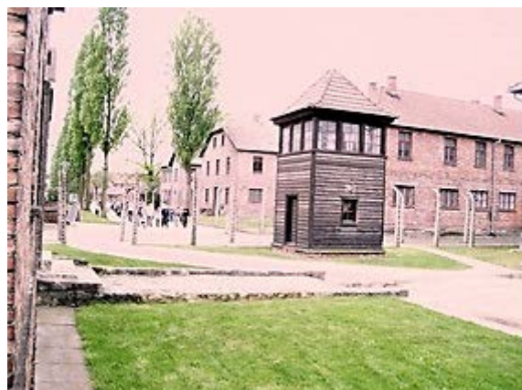
Фото 6: Проход через Stammlager (основной лагерь).