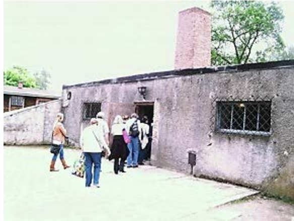
Фото 9: Вход в крематорий 1.