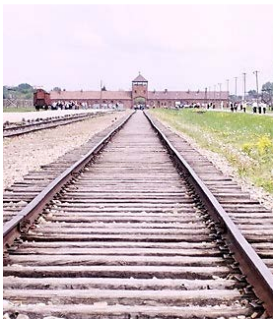
Фото 18: Главный вход Биркенау.

Это был мой первый визит в Освенцим, и я решил, что буду смотреть на него, как смотрел бы обычный турист. Это было не только проще (я путешествовал один), но и позволило бы лучше понять «официальное» изображение лагеря и событий там. Освенцим – туристическое направление номер один во всей Польше. Ежегодно лагерь посещают около 1,3 миллиона человек – по случайному совпадению, примерно столько же, сколько там, как утверждается, было убито. Официальные экскурсии диктуют конкретный образ лагеря, и я меня этот образ интересовал так же, как и сам лагерь. Я хотел увидеть то, что видит публика.