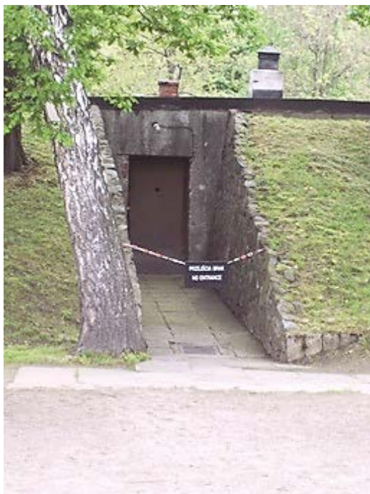
Фото 8: «Вход для заключенных».