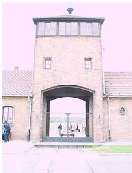
Фото 12: Главные ворота Биркенау.