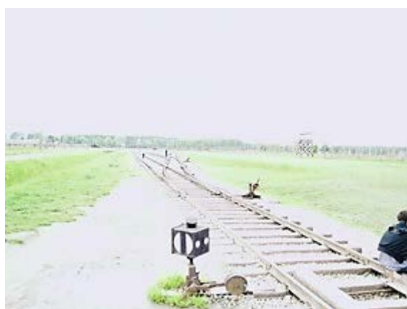
Фото 13: Железнодорожные пути, которые ведут к газовым камерам.