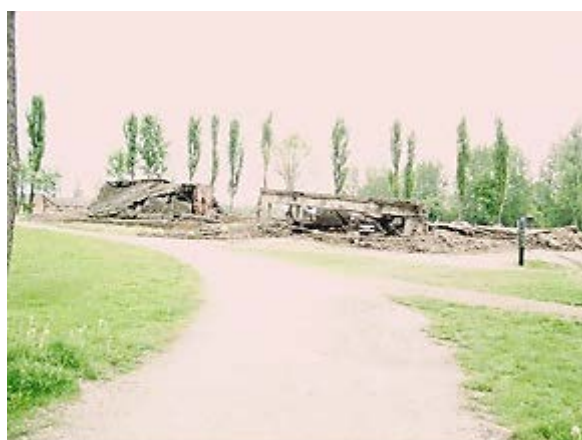
Фото 14: Руины крематория 2.