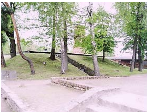
Фото 7: Предполагаемая газовая камера (крематорий 1).