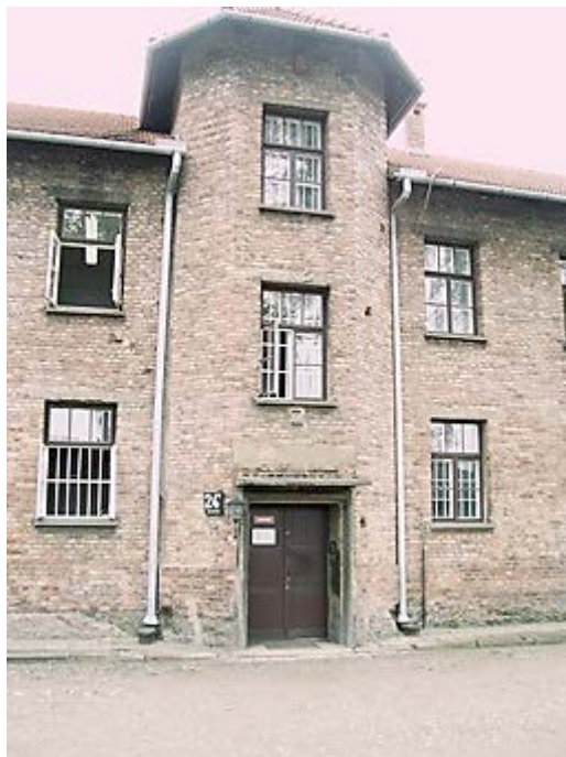
Фото 5: Блок 24 (бордель и библиотека).

На заднем плане Фото 4 виден блок 24, здание, в котором размещались бордель и библиотека для заключенных (не евреев); главный вход показан на Фото 5. Фото 6 показывает типичный вид лагеря, с бараками и сторожевой вышкой.