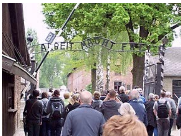
Фото 3: 'Arbeit Macht Frei' («Труд делает свободным»).