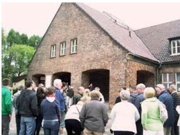
Фото 2: Вход в музей Освенцима