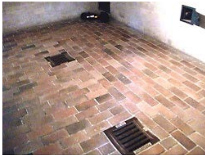
Фото 3: Пол газовой камеры.

Ну вот, теперь больше не душевые головки поставляют смертельный газ, но он исходит с пола. Там действительно есть подвальное помещение под газовой камерой, но у нас вообще нет доказательств, что это была «комната для смешивания Циклона», или что такой газ поступал в помещение снизу. Сегодня в камере есть шесть отверстий в полу, и, по всем данным, они на самом деле являются и всегда были дренажными отверстиями для слива воды (фото 3). Это логично, потому что комната, скорее всего, была с самого начала построена как обычная душевая для заключенных.