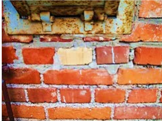
Фото 18: Изменение штукатурки в правом отверстии подающего лотка.