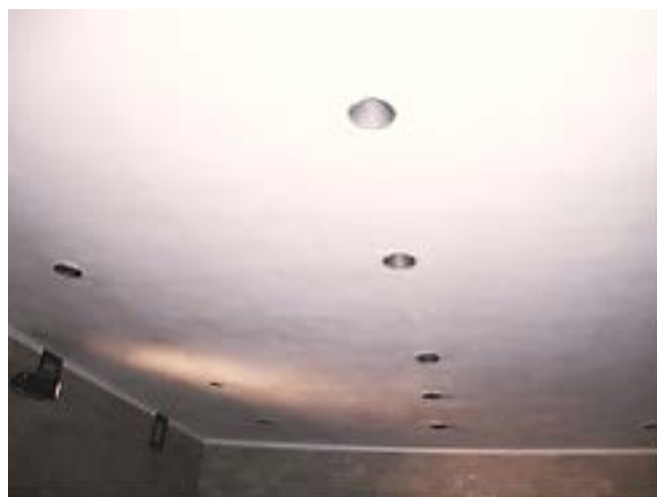
Фото 4: «Бутафорские душевые головки»