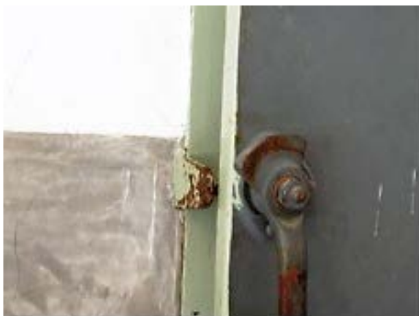
Фото 9: Запорное устройство на выходной двери.