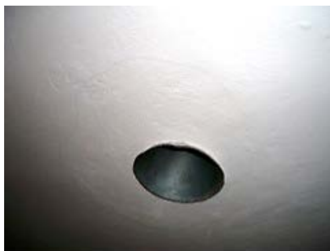
Фото 7: Заново сделанный потолок вокруг душевой головки.