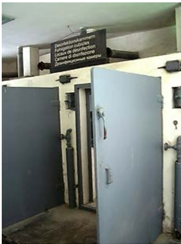
Фото 14: Дезинфекционная камера для уничтожения вшей.