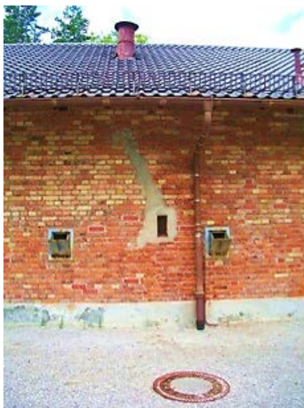
Фото 13: Два отверстия локтов для подачи Циклона.