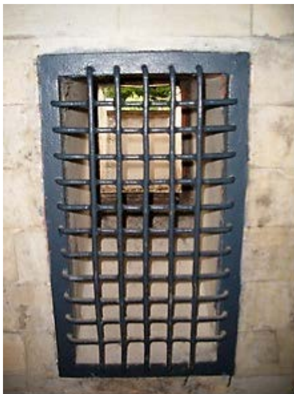
Фото 12: Отверстие для Циклона и решетка.