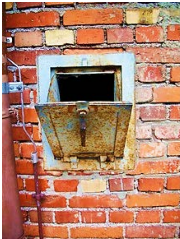
Фото 17: Правое отверстие лотка для подачи Циклона.