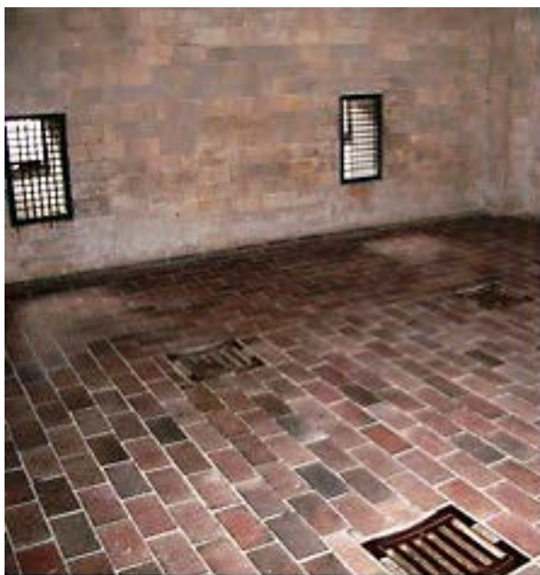
Фото 11: Два отверстия с решетками для Циклона.