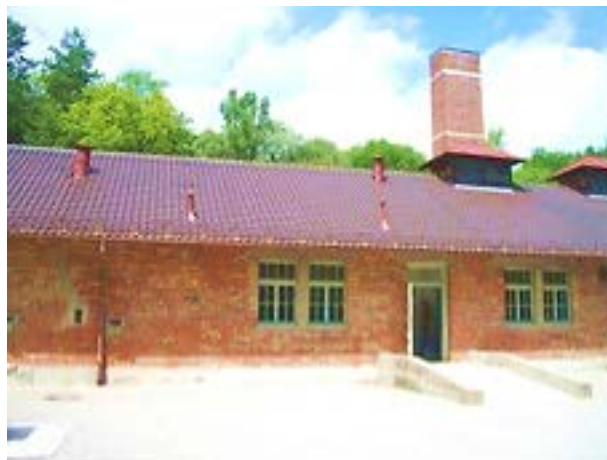
Фото 1: Крематорий снаружи (место газовой камеры слева).

Приведенное ниже исследование является результатом моего личного визита в Дахау в течение трех дней в середине 2011 года. Все фотографии, включенные ниже, мои. На фотографии 1 показан внешний вид здания крематория, с наружной стенкой газовой камеры слева (за водосточной трубой). Фотография 2 – нынешний план здания (в горизонтальной проекции).