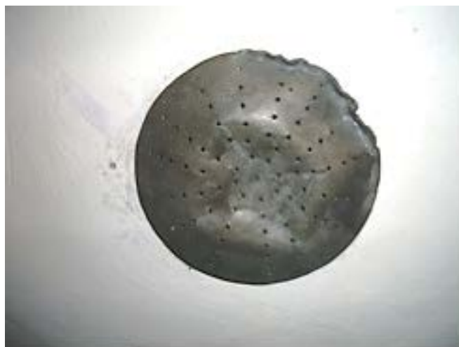
Фото 5: Единственная оставшаяся в исправном состоянии головка.