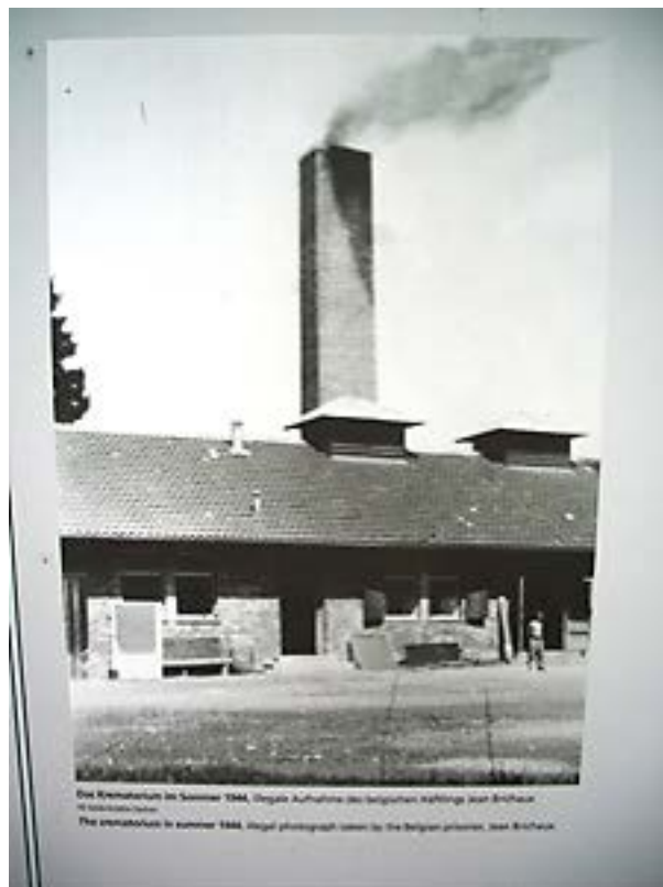
Фото 19: Крематорий летом 1944 года.

Американские газеты поспешили сообщить ужасные новости. О визите некоторых известных журналистов 2 мая, устроенном генералом Эйзенхауэром, в «New York Times» сообщалось: