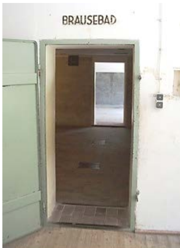
Фото 8: Вход в газовую камеру.