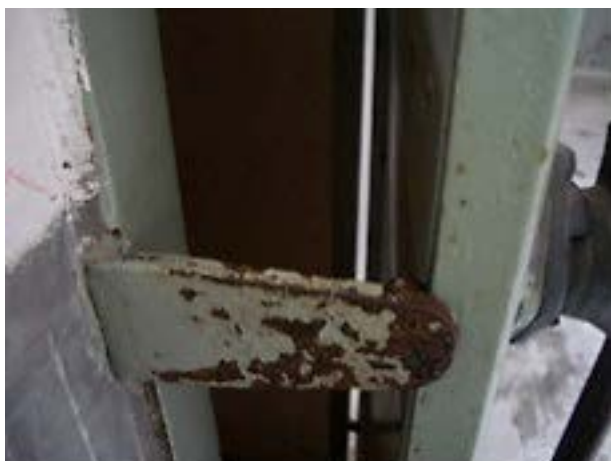
Фото 10: Запорное устройство на выходной двери.