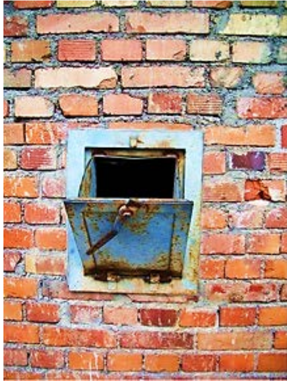
Фото 16: Левое отверстие лотка для подачи Циклона.