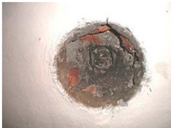
Фото 6: Отсутствующая воронка.