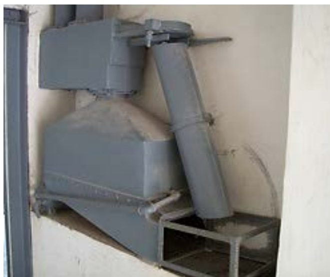
Фото 15: Устройство для дезинфекции горячим воздухом.