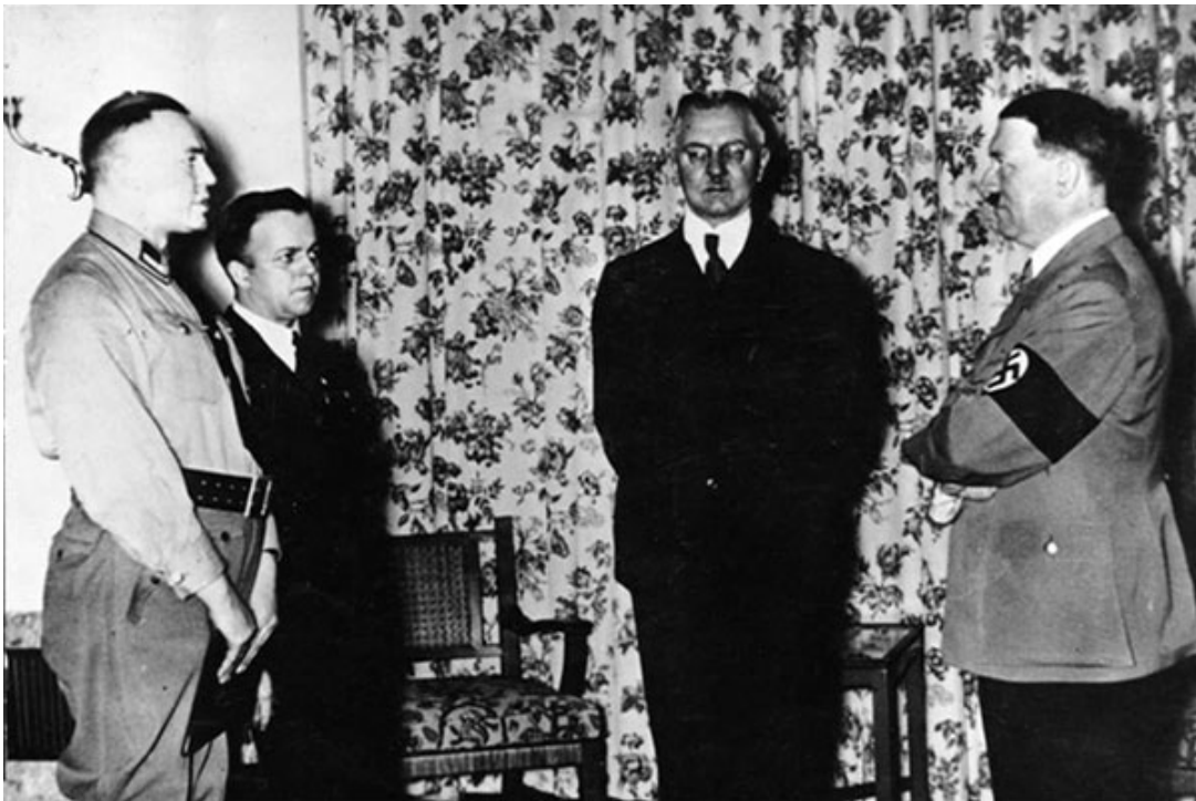
Адольф Гитлер дискутирует с рейхсминистром экономики и президентом Рейхсбанка доктором Ялмаром Шахтом в 1936 году.