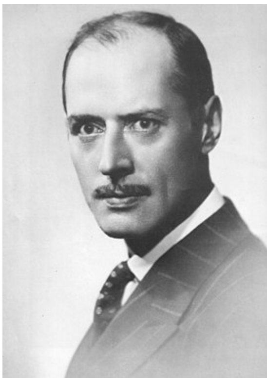
Адриен Аркан (1899-1967)