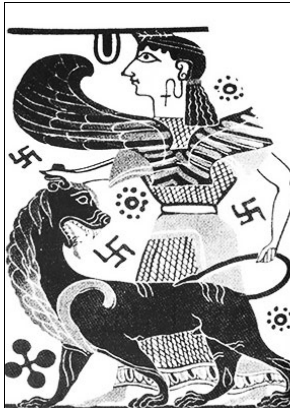
Gerhardsches Fragment: Geflügelte Herrin der Tiere. Berlin, Staatl. Museum

Wie alle echten Gottheiten, so läßt sich auch Athene nicht aus einer einzigen, besonders augenfälligen Wirksamkeit verstehen. Der kraftvolle Sinn, der sie zum Genius der Sieghaftigkeit macht, hat eine Weite, die der Gesichtskreis des Schlachtfeldes nicht ausmessen kann. Nur die „helläugige Klugheit“, in jedem Augenblick das Entscheidende zu erkennen und das Zweckdienlichste herzustellen, füllt mit der Vielseitigkeit ihres lebendigen Wirkens sein Ideal ganz aus.